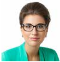
Olga Ivanova, Riigikogu liige