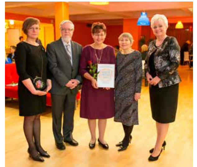
Külalised peale kontserti muljeid vahetamas.