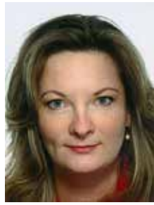
Dei Stein noorsoopolitseinik

Alanud on aastalõpu pühade periood ning politsei tahab tähelepanu pöörata peamistele murepunktidele, mis on just pidudega seotud. Allpool on toodud üks tüüpiline väljakutse, millele politsei peab kiiremas korras reageerima. Samas on olemas mitmeid võimalusi, et taolisi väljakutseid vältida.