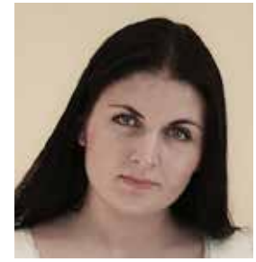
Önneli Matt-Sermat jurist Öigusnõu OÜ

Lisaks kriminaalõigusele on isikuõiguste kaitseks ka tsiviilõiguses erinevad kaitsvad normid, mille kohaldamist saab jurist kohtus nõuda.