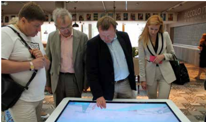
Ülemiste City jätis delegatsioonile unustamatu mulje