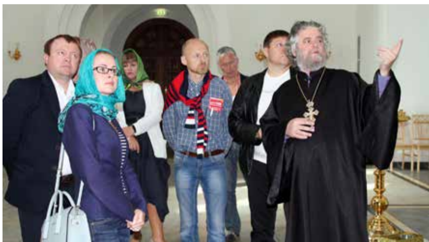
Tallinna Jumalaema Kiirestikuulja ikooni kirikut imetlemas