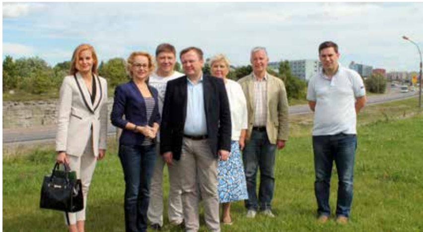
Valgevene külalised Lasnamäe kanali taustal